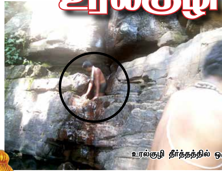
உரல்குழி தீர்த்தத்தில் ஒரு நபர் மட்டுமே இறங்க முடியும்