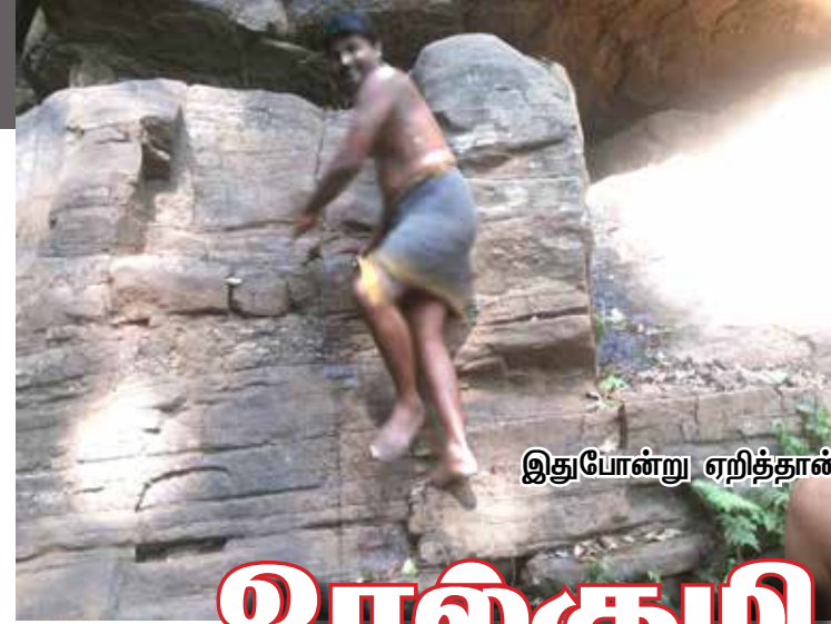
இதுபோன்று ஏறித்தான் உரல்குழி தீர்த்தத்திற்கு செல்லவேண்டும்.